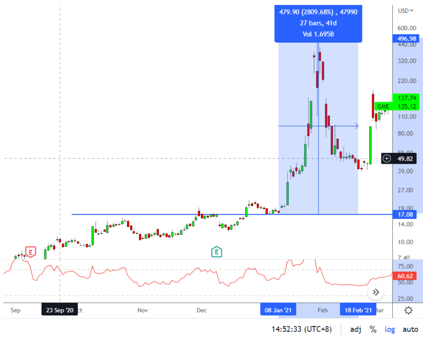
GME 2021/1-2021/2 股價走勢圖

事後WSB的網友們也陸續炒作AMC、黑莓機等相關空單比重高的公司，股價也都在短期內大漲後迅速回落，這可以說是近期最大的嘎空事件。