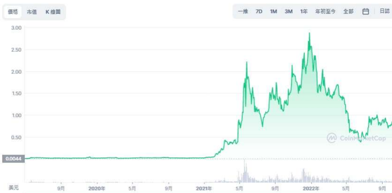
圖表：Polygon 到 USD

後來隨著加密市場復甦，MATIC 的價格也逐漸穩定在 1.3 美元左右，不過由於加密熊市和美股的影響，使得加密貨幣再度下修，MATIC 價格也下滑到 0.8 美元左右。