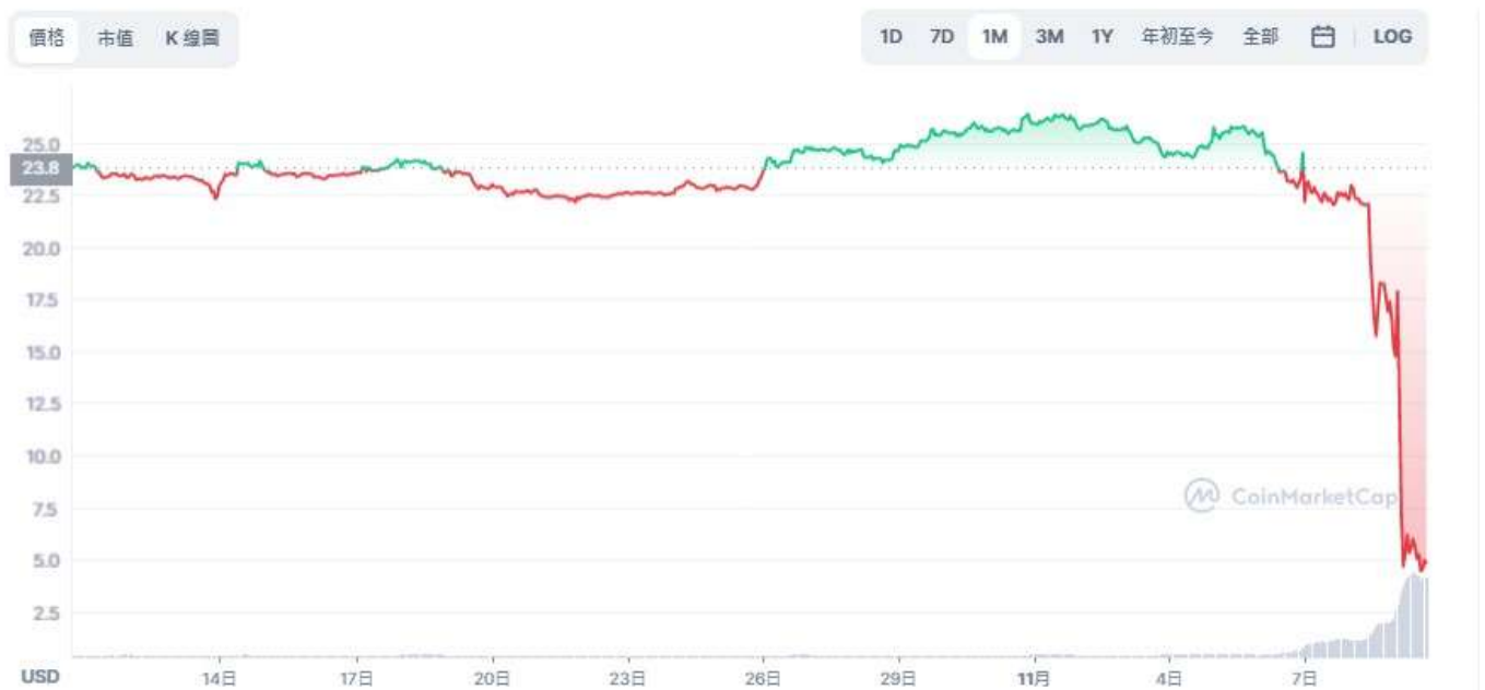
圖表：FTX Token 到 USD