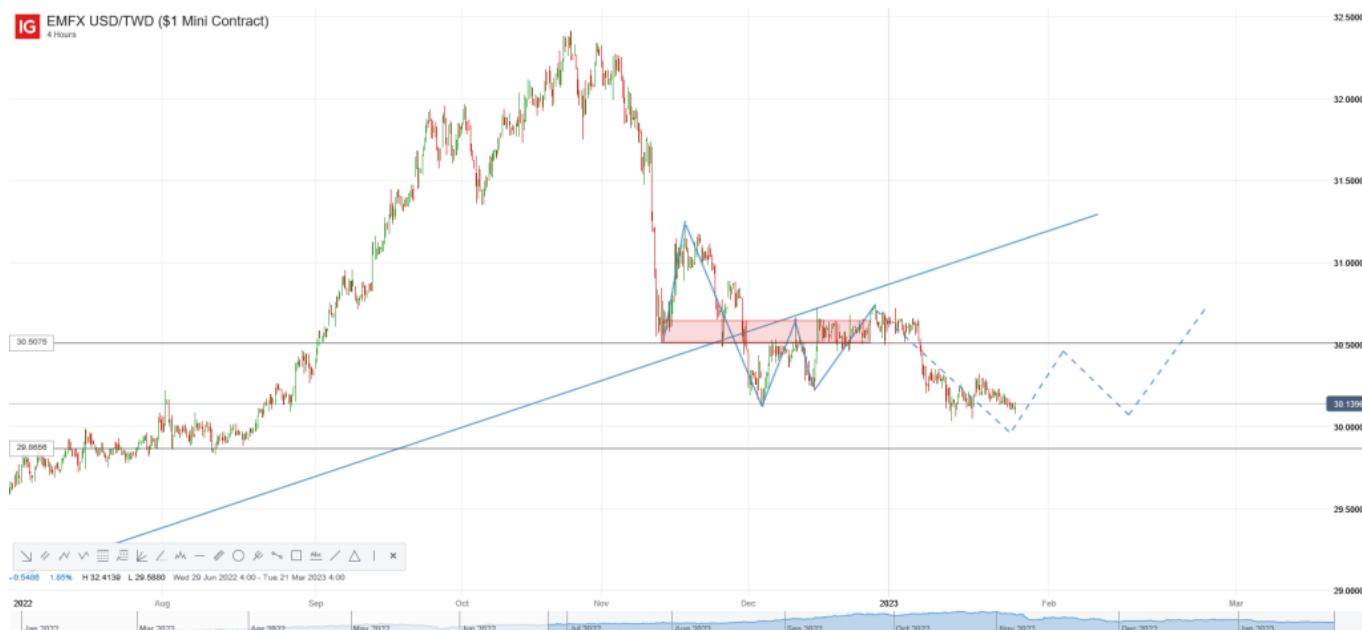
美元/新台幣日線圖

不過，考慮到美元/新台幣已擊穿長期上升趨勢線，若要扭轉中期趨勢則意味匯價需突破31.5水平。因此，預計美元/新台幣在反彈修正後仍將再度下行考驗30關口支持，而有效擊穿30關口則意味下方空間被打開。