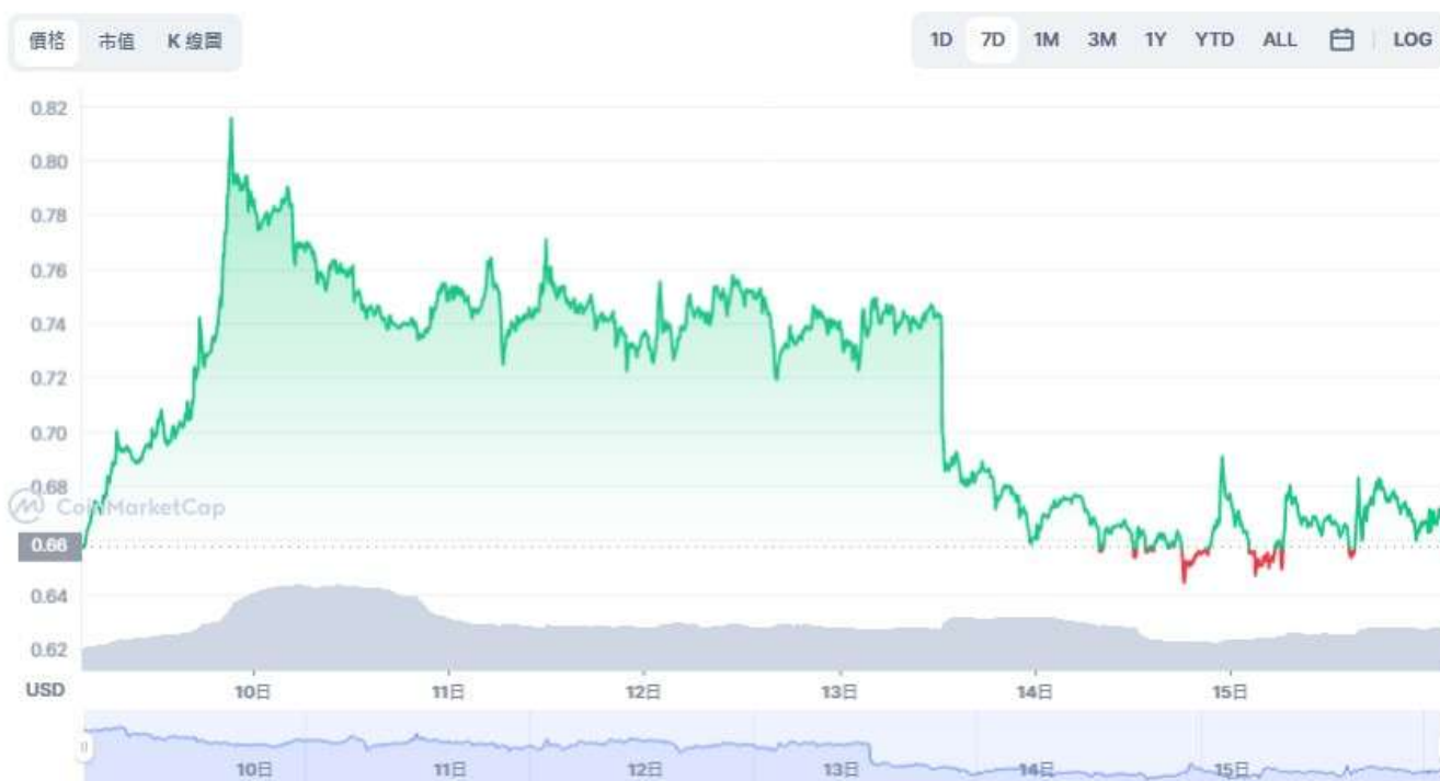
圖表：STEPN 到 USD

在撰寫本文時，GMT 報價 0.6655 美元，近 24 小時上漲 1.58%，其交易量也上漲 34.62% 至 149,496,535 美元。