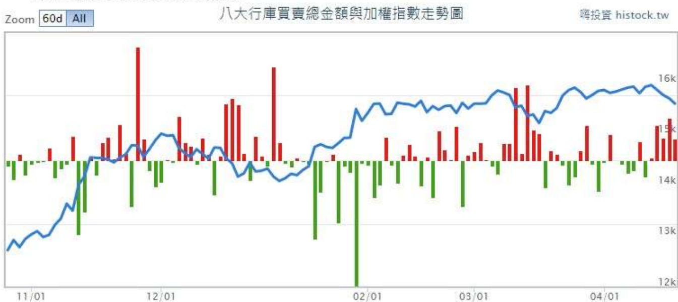
04-21 八大官股銀行/公股行庫買賣總金額走勢圖