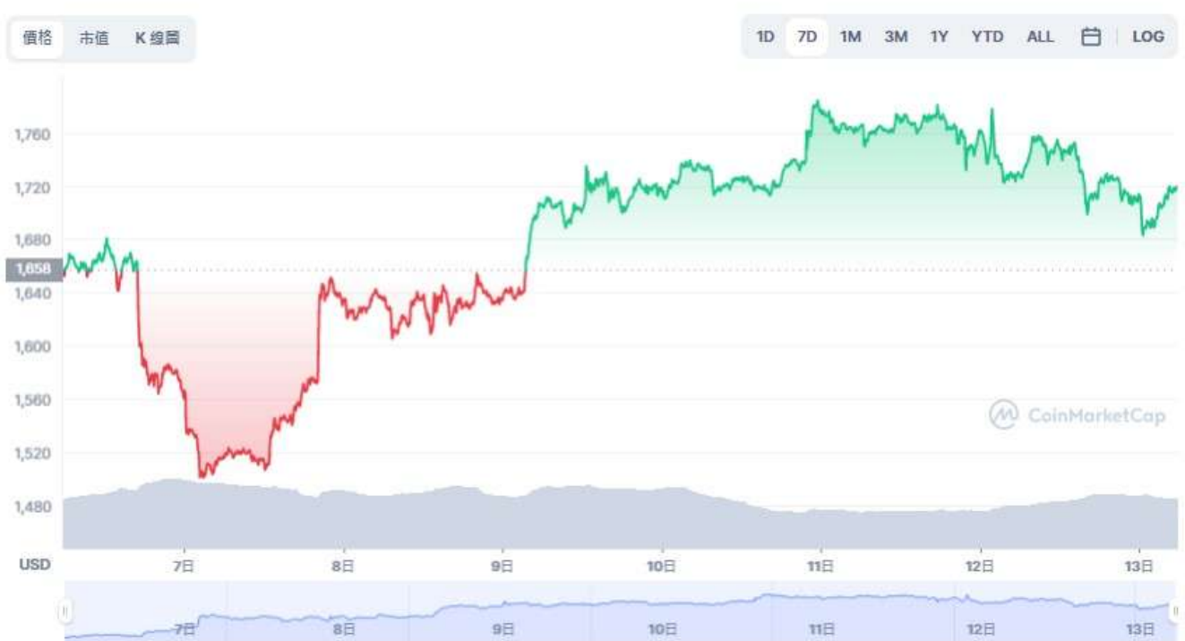
圖表：Ethereum 到 USD