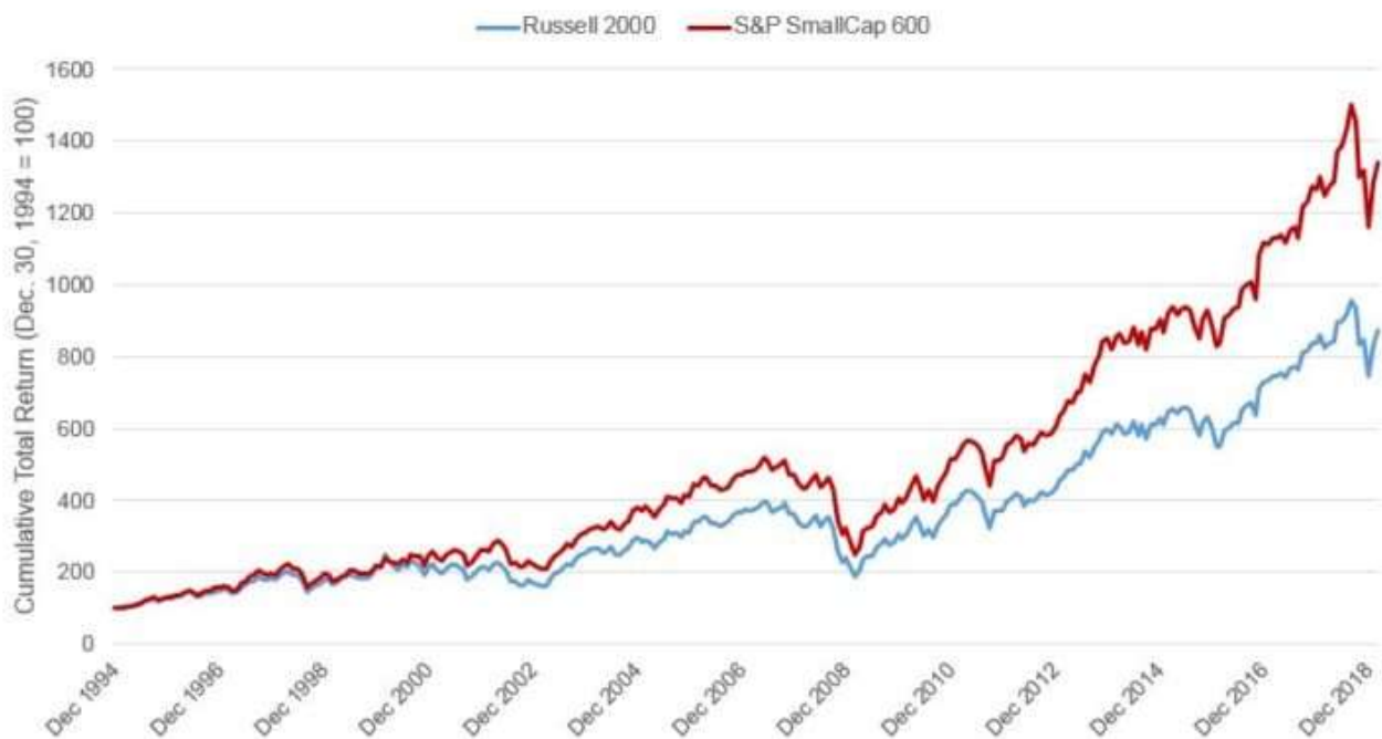
Exhibit 1: A positive earnings screen helped the S&P 600 to outperform, historically.

Chart based on monthly total returns between Dec. 1994 and Feb. 2019. Past performance is no guarantee of future results. Charts is provided for illustrative purposes only.