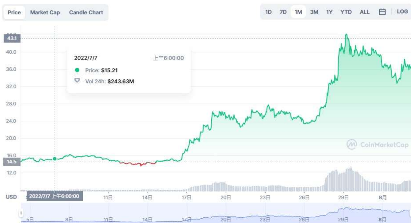
圖表：Ethereum Classic 到 USD

在過去的 9 多周裡，ETC 成功實現了 180 度翻轉。從近一個月的數據看，ETC 的漲勢喜人，在上週五單日漲幅高達 43.39 %。當前，ETC 報價 36.83 美元。