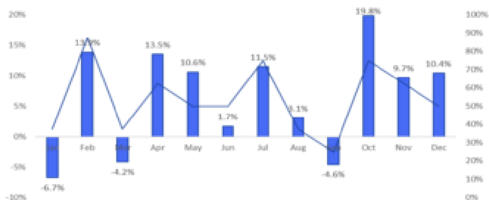
Exhibit 4: Bitcoin seasonality, avg. returns per month (LHS) vs. percentage of months positive (RHS)

此外，對 2023 年底的預期也仍然非常樂觀，因為 Thielen 還認為比特幣未來價格可能升至 45,000 美元。Thielen 表示，「比特幣往往會上漲 10,000 點，然後回撤 5,000 點，然後再上漲 10,000 點（直到年底達到 45,000 美元）。」