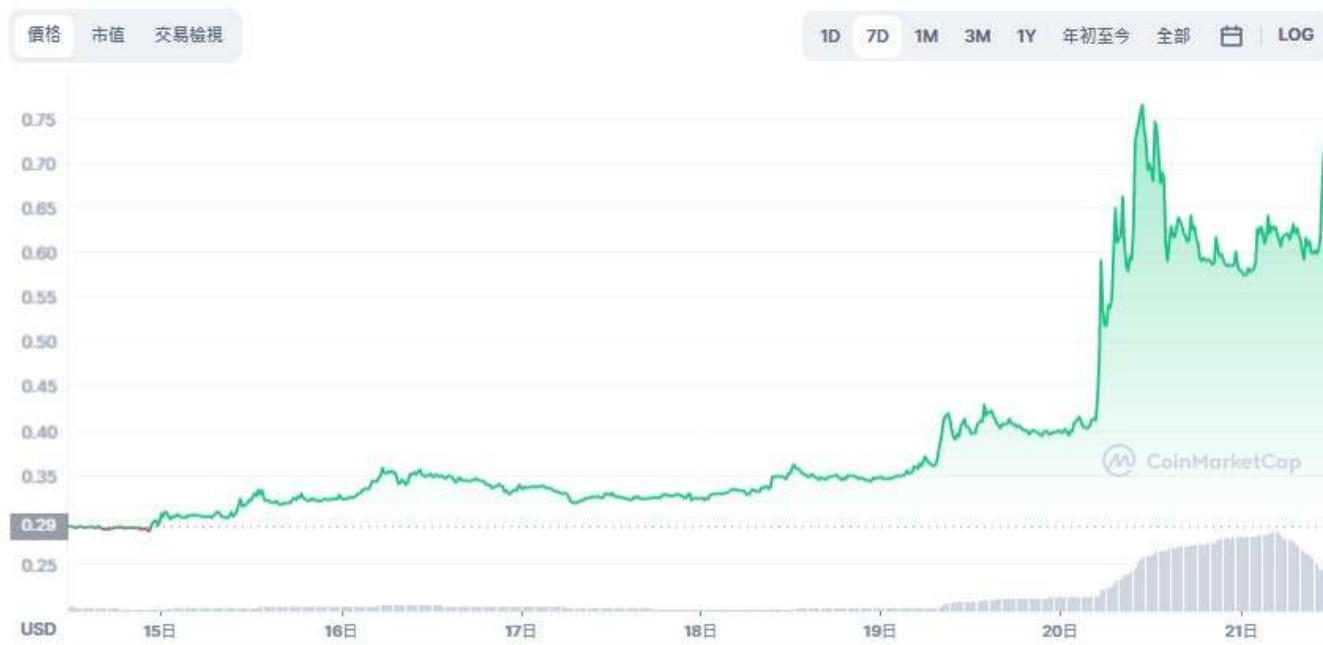
圖表：Stacks 到 USD

在開始投資Stacks (STX) 前，您需要對該加密貨幣項目有一定的認識。下文我們將會對 STX 幣進行詳細的介紹。