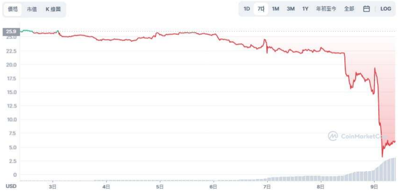
圖表：FTX Token 到 USD