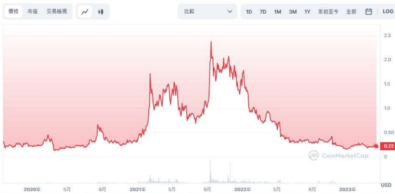
圖表：Algorand 到 USD

根據 Coinmarketcap 的數據，Algorand 的開盤價為 2.89 美元。