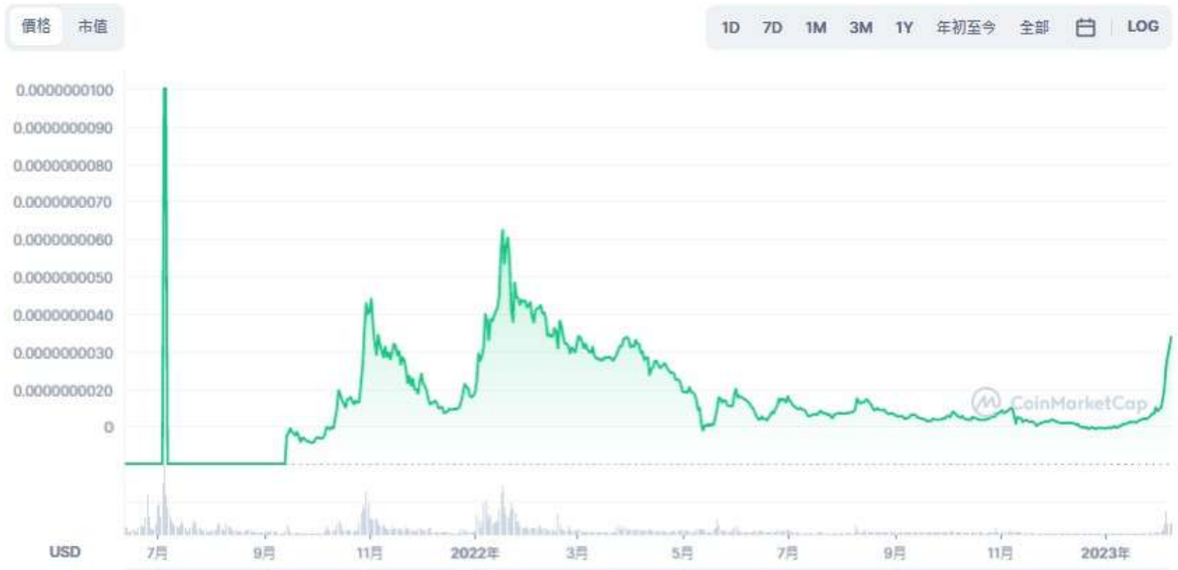
圖表：Baby Doge Coin 到 USD

歷史圖表數據顯示，BABYDOGE 在2021 年6 月推出時的交易價格低於0.0000000001 美元。2021 年7 月4 日，在名人Lil Mook和Elon Musk發布關於該代幣的推文後，該代幣幾乎翻了一番，達到0.00000002 美元的歷史新高，吸引了更廣泛的投資者關注。