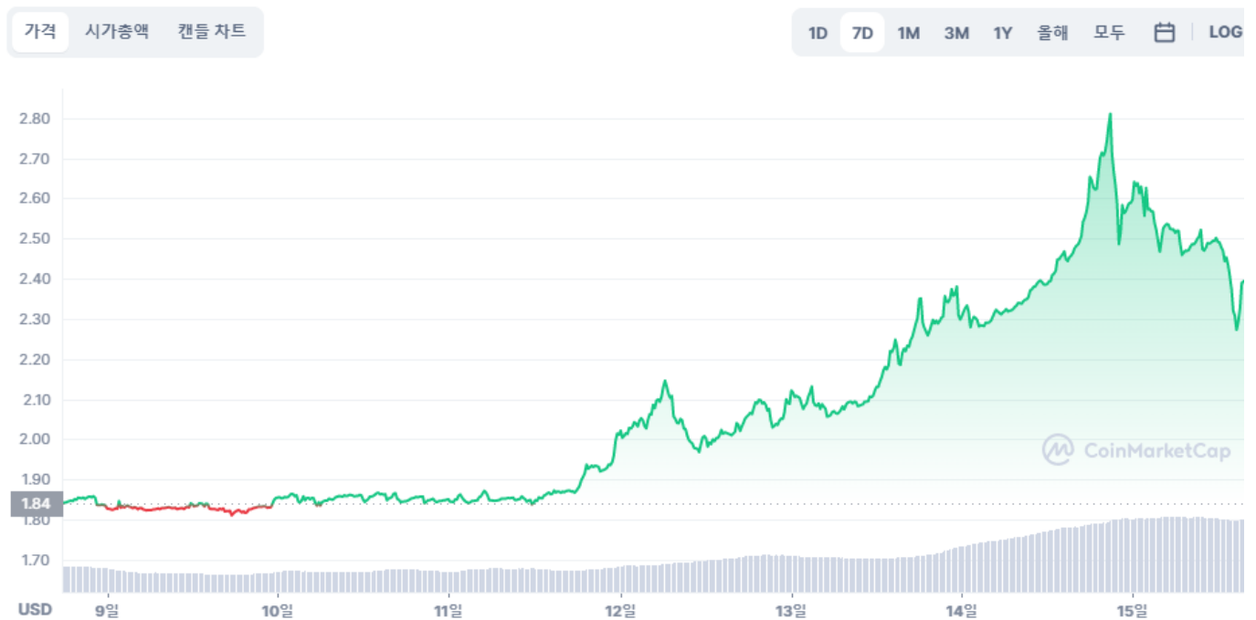
Toncoin 대 USD 차트

TON 코인은 현재 코인마켓캡에 22위에 올라 투자자들의 폭넓은 관심을 받고 있다. 텔레그램과의 관계는 이름을 바꾸면서도 프로젝트의 인기가 치솟는 데 도움이 되었다.