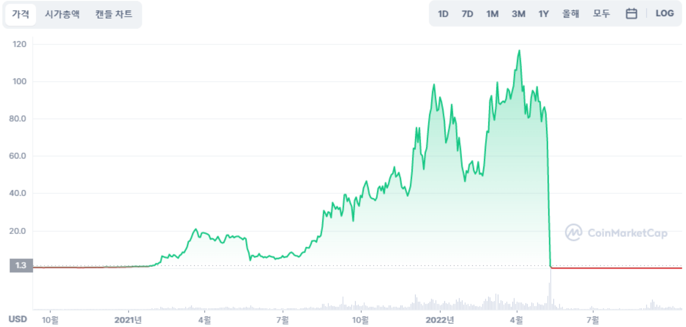
LUNC 출시후 가격 차트