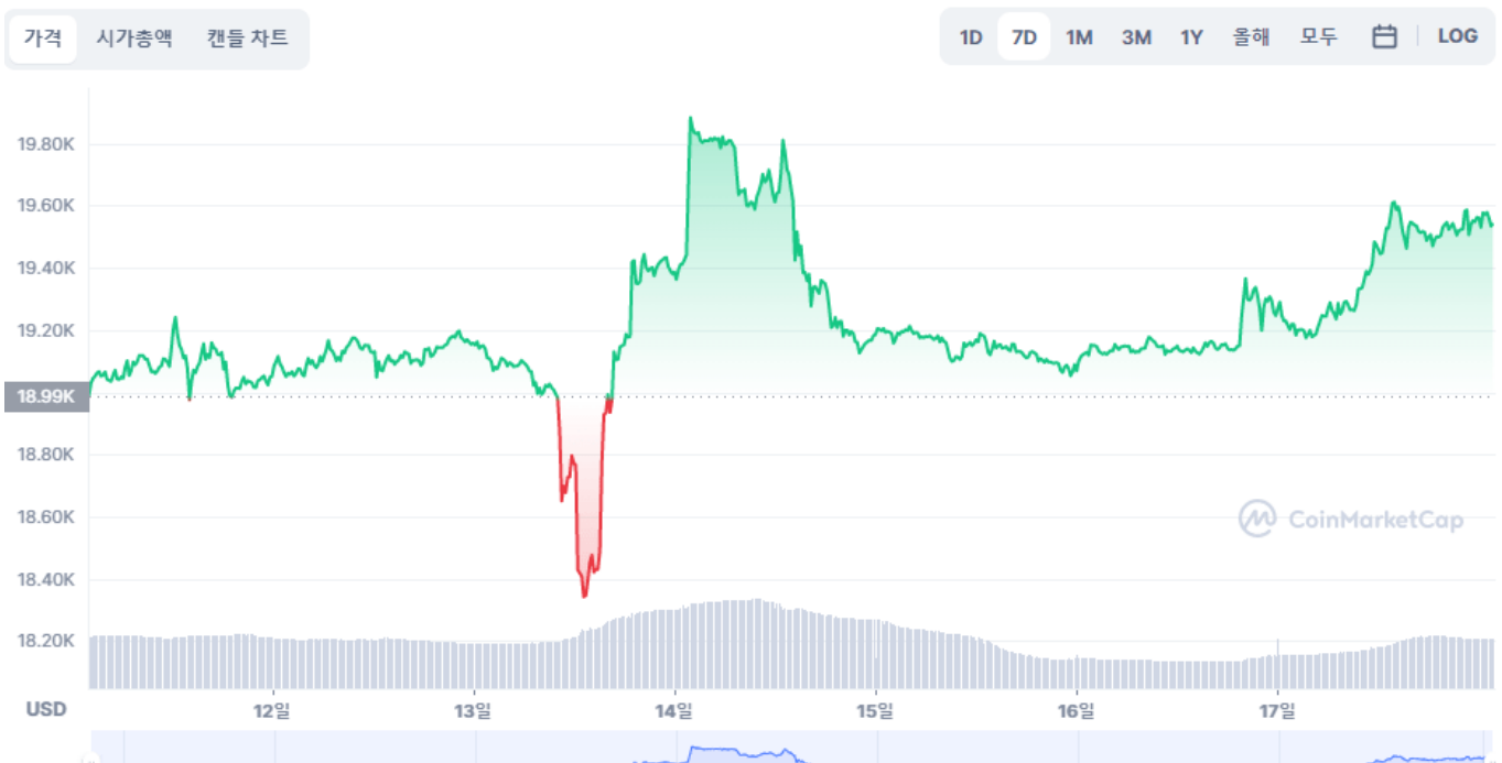
Bitcoin 대 USD 차트

주말 시작과 함께 최근 24시간 동안 소폭 상승했습니다. 비트코인은 최근 한 달간 1만9000~2만1000달러의 좁은 범위에서 거래를 이어오고 있습니다. 분석가들은 예상치 못한 촉매가 없는 한 지금 같은 추세가 이어