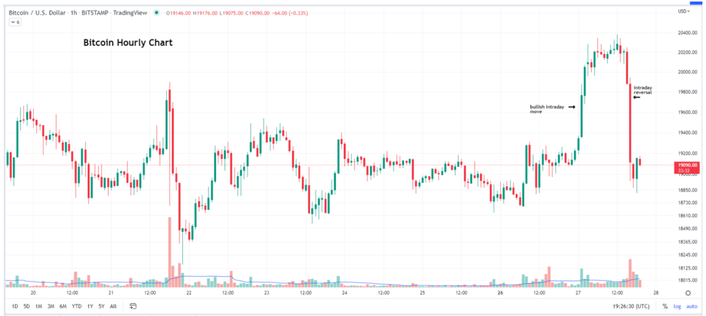
비트코인/미국 달러 시간대별 차트

시간대별 차트를 보면 비트코인은 과매수 영역으로 이동하면서 가격이 갑자기 역전돼 현재 과매도 상태임을 알 수 있습니다. 따라서 전날 최고가인 2만381달러를 유지할 수 없었습니다. 이는 최근 20일 평균 가격보다 약간 높은 가격입니다.