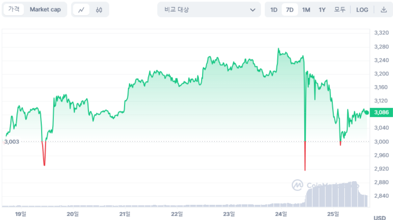
차트 시장 뉴스 상세 정보

현재 동부 표준시 오후 15시 10분 기준, ezETH는 여전히 2.39% 하락한 3,087달러에 거래되고 있습니다. 이러한 급격한 하락은 많은 투자자들을 당황케 했습니다. 특히, ezETH는 렌조 프로토콜 내 이더리움과의 패리티를 유지하기 위해 설계된 유동성 재투자 토큰(LRT)의 역할을 고려할 때 더 그랬습니다.