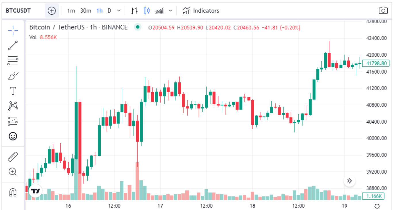
0.25% 금리 인상 후, 비트코인 가격 변화

연준은 3월 17일 (한국시각) 연방공개시장위원회(FOMC) 정례회의 후 성명을 내 현행 0.00~0.25%인 연방 기준금리를 0.25~0.05%로 0.25%포인트 인상한다고 발표했습니다. 연준의 금리 인상은 지난 2018년 12월 이래 3년 3개월만에 처음이다. 연준은 팬데믹 발발에 따른 경기 침체를 막기 위한 통화 완화정책으로 2020년 3월부터 제로금리를 유지해왔습니다.