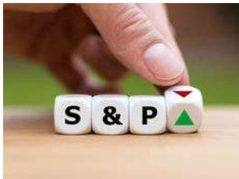
S&P500、米国の代表的な株価指数

他にもアメリカ株価を把握したい場合はのS&P500やナスダック、中国の場合は上海総合指数などがあります。