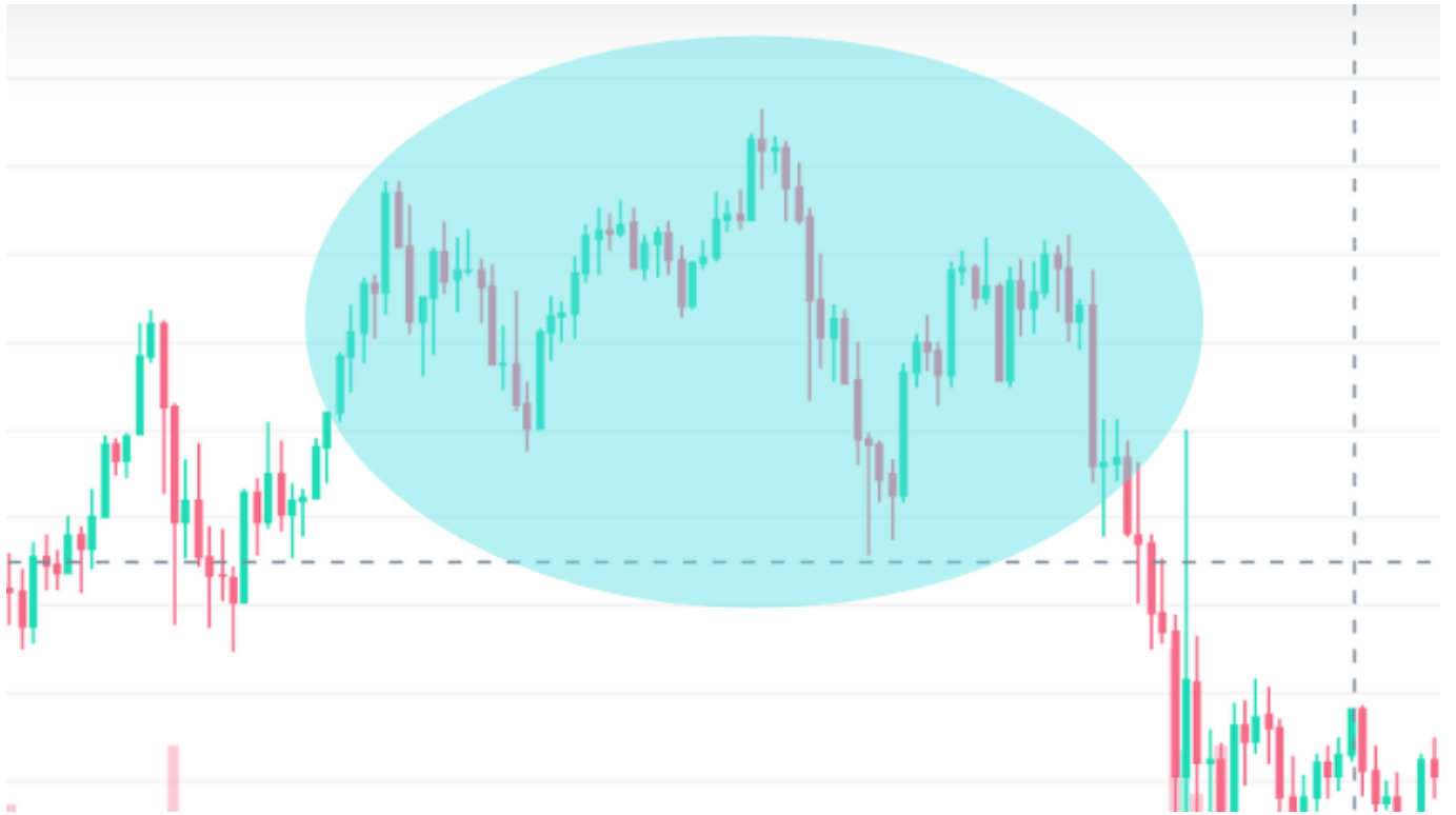
暴落前によく頻出するチャート