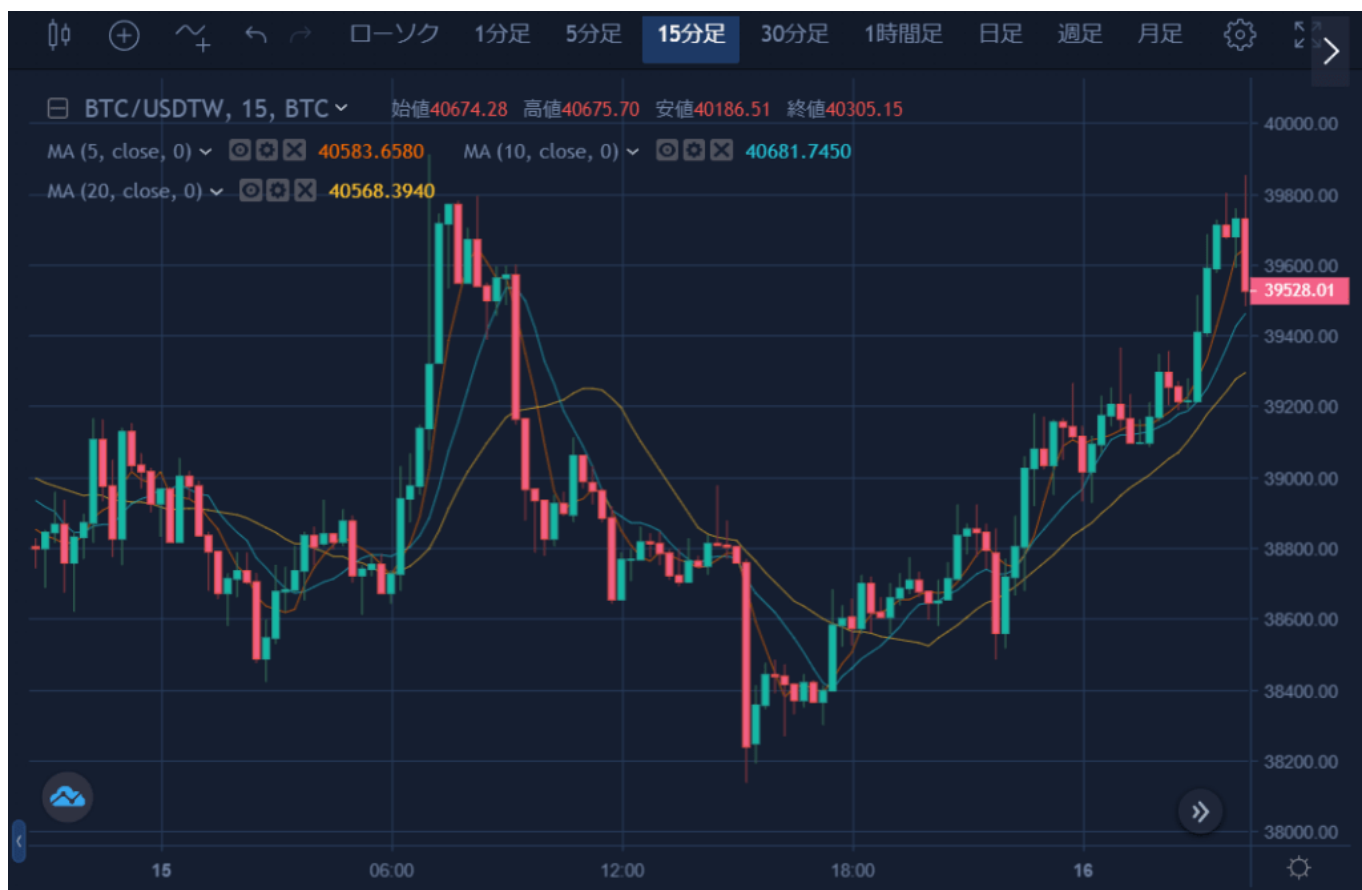
BTC対米ドルチャート（15分足）

前日比ではプラスであるが、日本時間10時頃には1000ドルほど急落するなど不安定な値動きが続く。ボラティリティ（価格変動性）は縮小傾向にある。