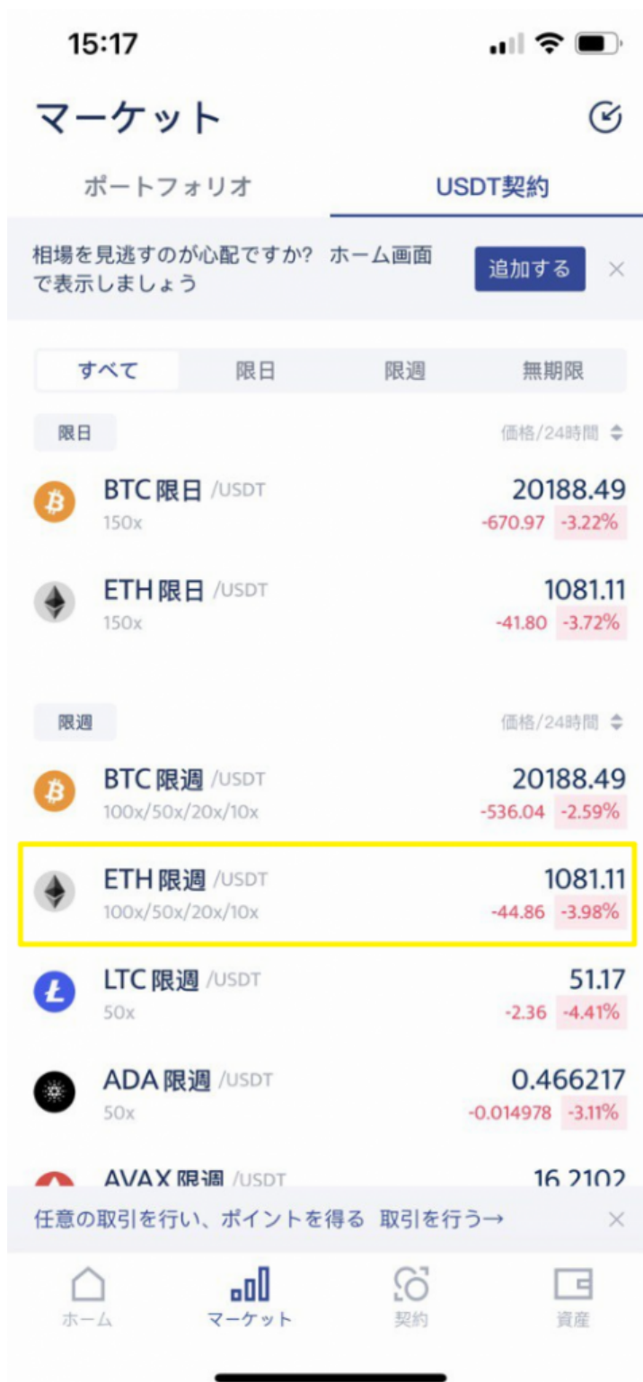
BTCC一マーケット画面