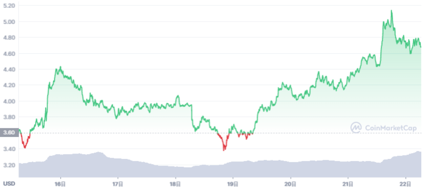
UNI/USDT 7日 チャート

4月にユニスワップラボ・ベンチャーズ (Uniswap Labs Ventures) のファンドを立ち上げた以来、積極的にMakerDAO、Compound Protocol (コンパウンド)、LayerZeroなどのDeFiとNFT、DAO関連のスタートアップとプロジェクトに投資しているユニスワップ、これからどう発展していくか楽しみにしている投資家も多いでしょう。