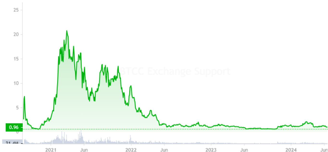
BTCC : Graphique de prix de SUSHI